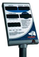
Power 5 Display

El resultado: potencia explosiva incomparable, la clave para el rendimiento superior atlético. Los botones para el control de resistencia se encuentran en los extremos de los mangos de agarre para un mayor control y estabilidad durante el ejercicio. Además, un dispositivo que limita el rango de movimiento ayuda a prevenir lesiones de ligamentos y articulaciones en la rodilla.