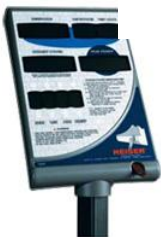
Power 5 Display

El Tablero Ajusta y controla tus entrenamientos realizando mediciones de: