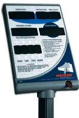
Power 5 Display

El Tablero Ajusta y controla tus entrenamientos realizando mediciones de: